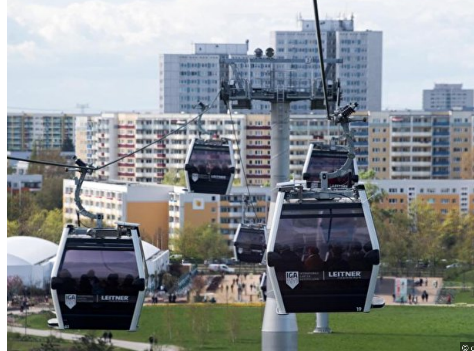
Besucher fahren in den Gärten der Welt mit der IGA-Seilbahn.

Das ergibt sich aus dem neuen Nahverkehrsplan 2019-2023, den der Senat am Dienstag (26. Februar 2019) bei seiner auswärtigen Sitzung in Brüssel beschloss.