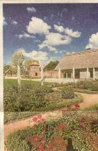
Ein Englischer Garten mit erwartet die Besucher auf dem IGA-