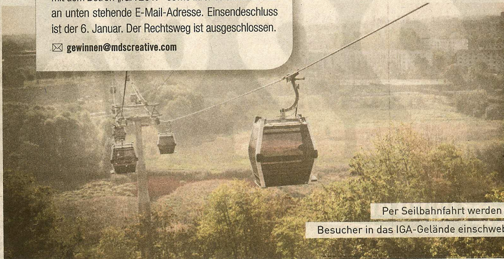
Per Seilbahnfahrt werden Besucher in das IGA-Gelände einschwe